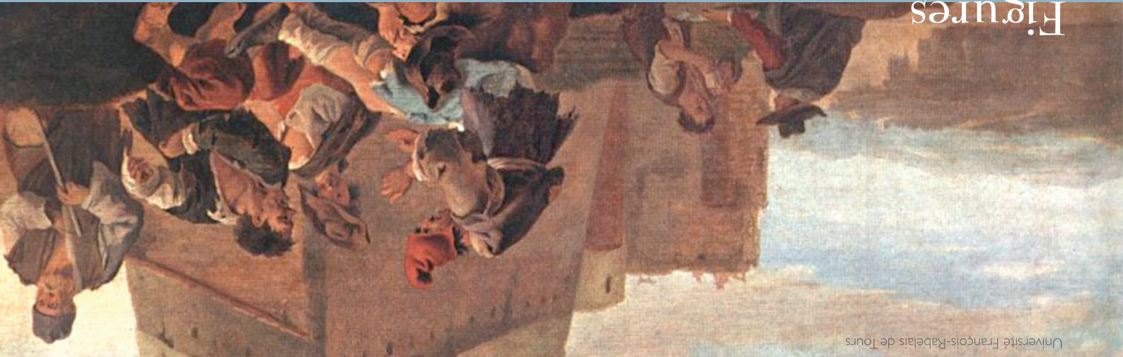
Université François-Rabelais de Tours